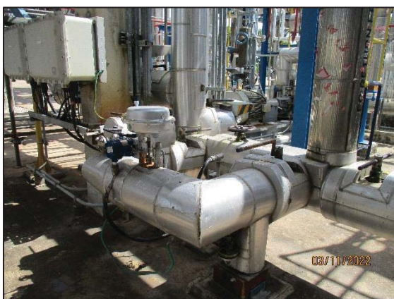
รูปที่ 3.37 ผนวมน้ำอุปกรณ์การผลิต เอทิลีนออกไซด์