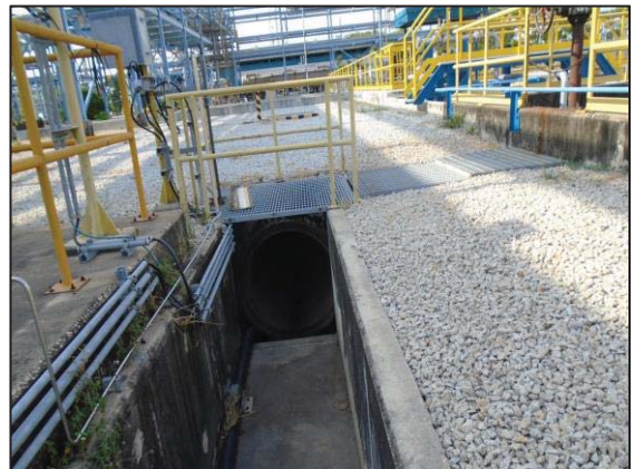
รูปที่ 3.22 Diversion Box