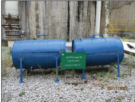
รูปที่ 3.9 ถังทลายดูดซับสารเคมี