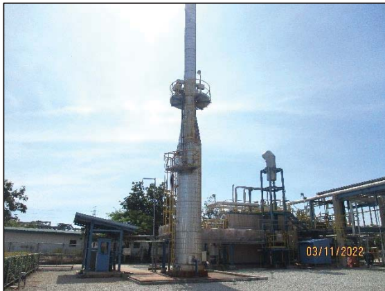
รูปที่ 3.1 Waste Heat Boiler