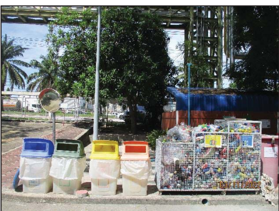
รูปที่ 3.25 ถังขยะแยกประเภท