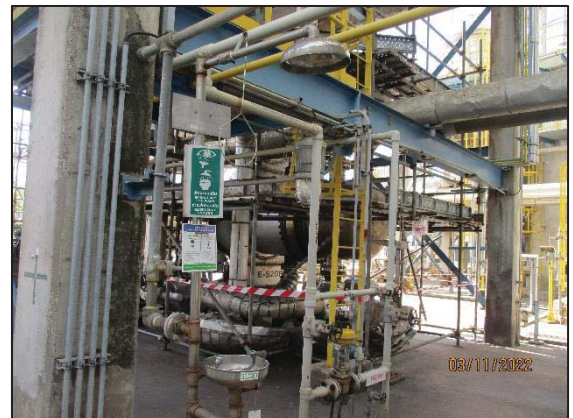
รูปที่ 3.48 Safety Shower