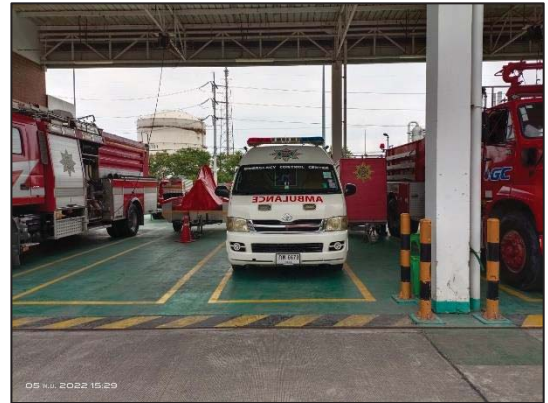
รูปที่ 3.28 รถพยาบาล (จอดที่ บ. NPC S&E)