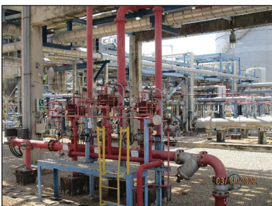
รูปที่ 3.43 Deluge System บริเวณถังเอทิลีนออกไซด์