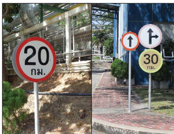
รูปที่ 3.19 ป้ายจำกัดความเร็วยานพาหนะ ในเขตพื้นที่หวงห้าม เช่น Process Area (20 กม./ชม.) และพื้นที่ควบคุม เช่น Warehouse (30 กม./ชม.)