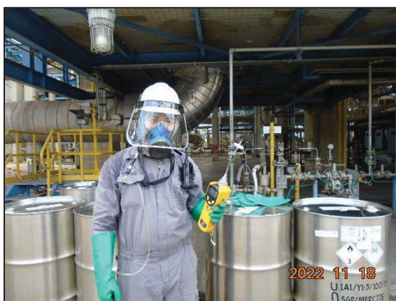
รูปที่ 3.7 การสูบล้างสารเอทิลีนไดคลอไรด์