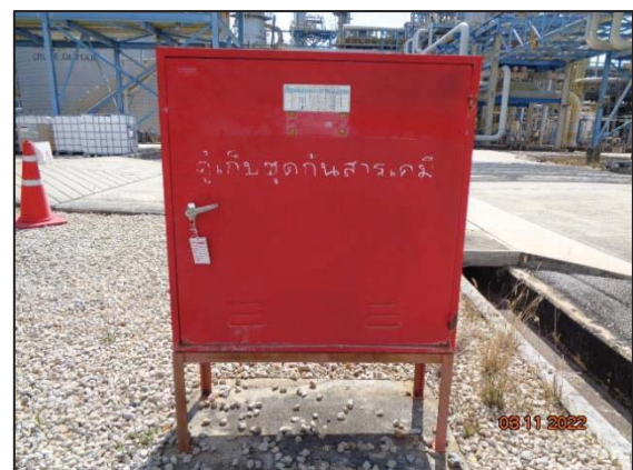
รูปที่ 3.24 ตู้จัดเก็บชุดสารเคมี บริเวณอาคารกักเก็บของเสีย