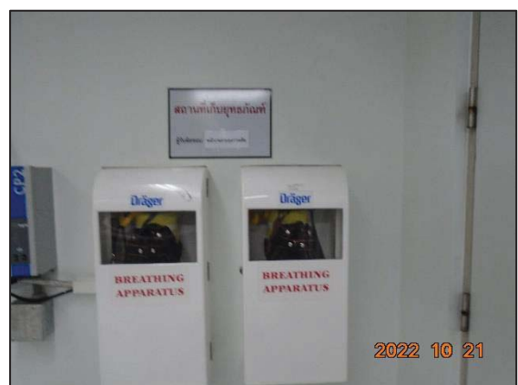
รูปที่ 3.26 Self Contained Breathing Apparatus (SCBA)