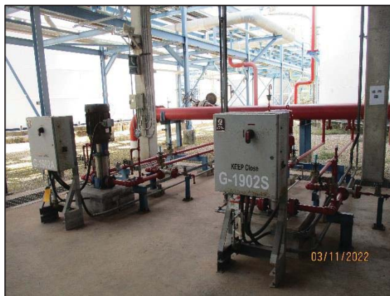
รูปที่ 3.59 เครื่องสูบน้ำดับเพลิงรักษาแรงดัน