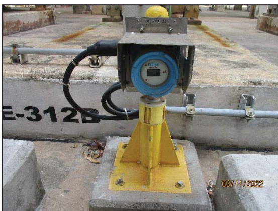
รูปที่ 3.55 Hydrocarbon Gas Detector