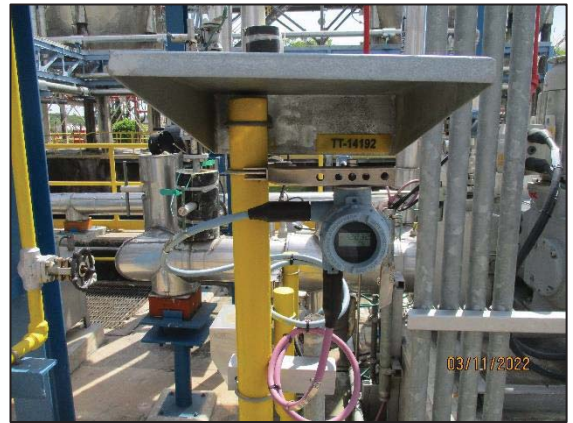
รูปที่ 3.52 High Temperature Interlocks