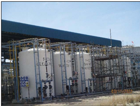
รูปที่ 3.11 หน่วยรีเวอร์สออสโมซิส