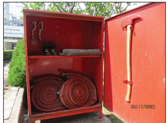
รูปที่ 3.60 ตู้เก็บอุปกรณ์ดับเพลิง