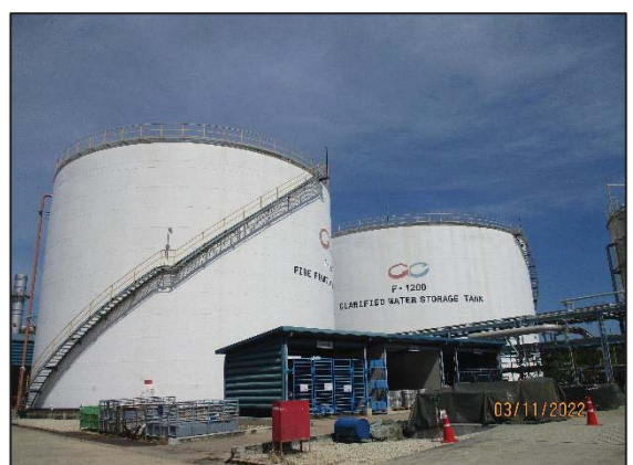
รูปที่ 3.56 ถังน้ำสำรองดับเพลิง