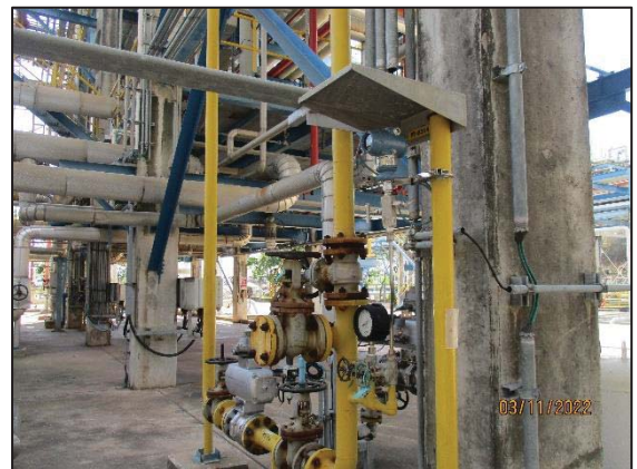
รูปที่ 3.54 Interlocks