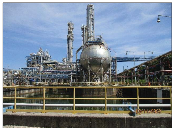
รูปที่ 3.14 คั่นกันบริเวณถังเอทิลีนออกไซด์