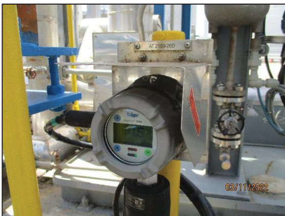
รูปที่ 3.31 เครื่องตรวจวัดก๊าซเอทิลีนออกไซด์