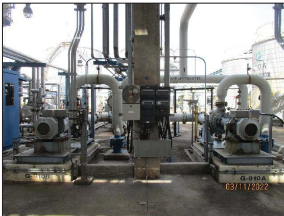
รูปที่ 3.51 Pump ชนิด Double Mechanical Seal