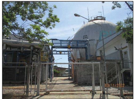
รูปที่ 3.4 Air Separation Plant