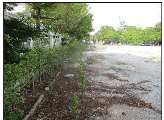
พื้นที่สีเขียวที่ปลูกเพิ่มเติม