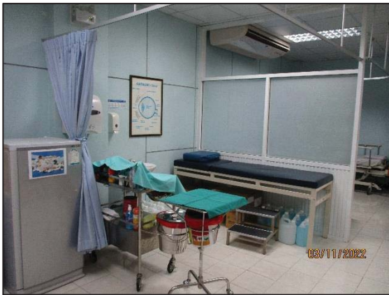
รูปที่ 3.29 อุปกรณ์ปฐมพยาบาล