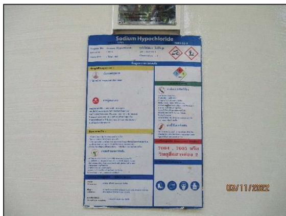
รูปที่ 3.33 ป้ายสัญลักษณ์แสดงความเป็นอันตราย ของสารเคมี (SDS)