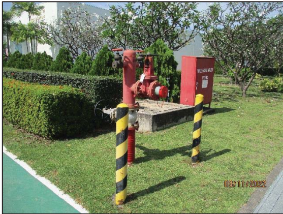
รูปที่ 3.45 Fire Water Hydrant