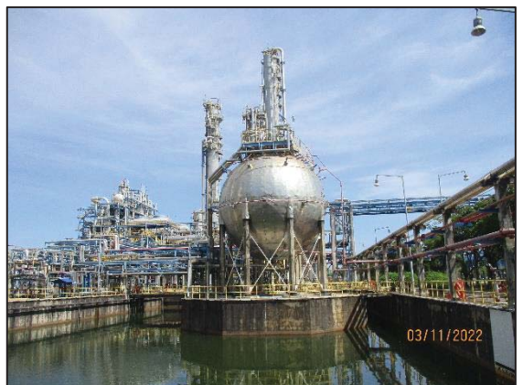
รูปที่ 3.42 EO Dilution Basin