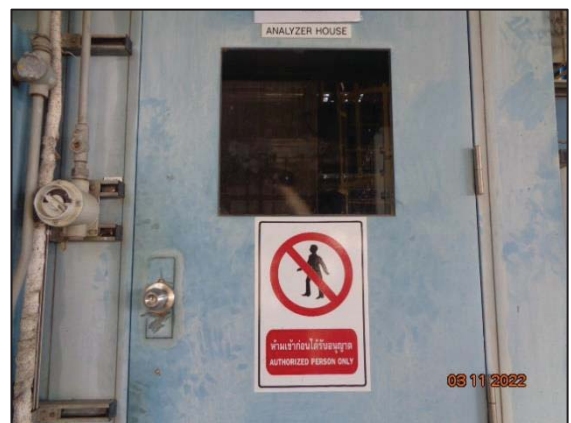
รูปที่ 3.32 บ้ายเตือนไม่ให้ผู้ที่ไม่เกี่ยวข้อง เข้า-ออกโดยไม่ได้รับอนุญาต