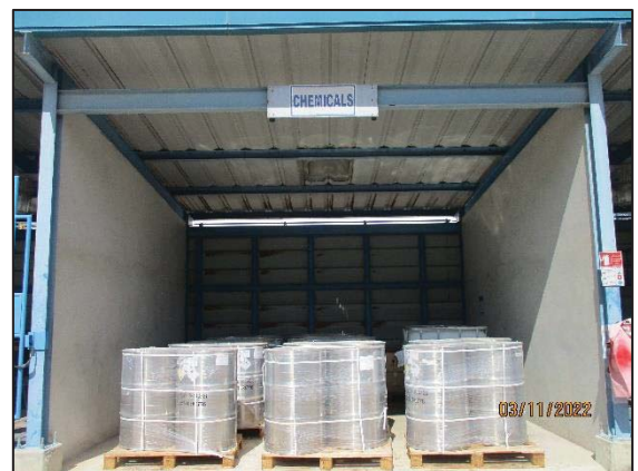
รูปที่ 3.8 อาคารจัดเก็บสารเคมี