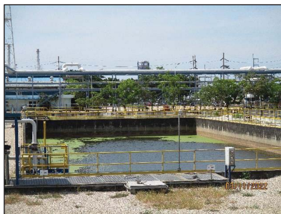
รูปที่ 3.13 Final Check Basin (F-1803)