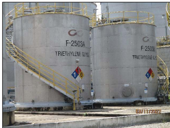
รูปที่ 3.34 ป้ายเตือนให้ทราบถึง ขอบเขตการเก็บสารเคมี