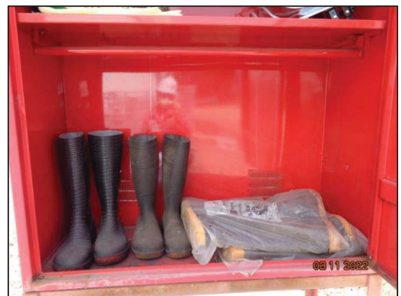
รองเท้าป้องกันสารเคมี