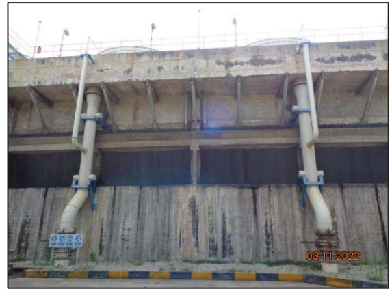
รูปที่ 3.12 Cooling Water Blowdown