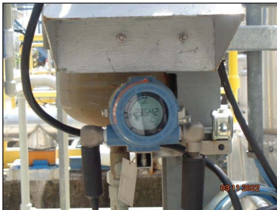
รูปที่ 3.41 Pressure/Temperature Indicator