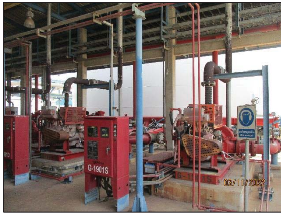
รูปที่ 3.57 เครื่องสูบน้ำดับเพลิง ชนิดเครื่องยนต์ดีเซล