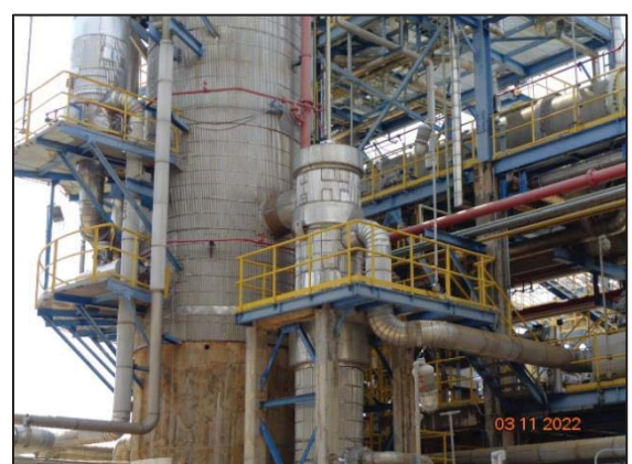
รูปที่ 3.50 Tower Bottom Stream