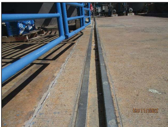
รูปที่ 3.35 ร่องระบายน้ำเพื่อป้องกันสารเคมีรั่วไหล