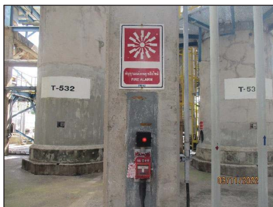
รูปที่ 3.47 Fire Alarm System