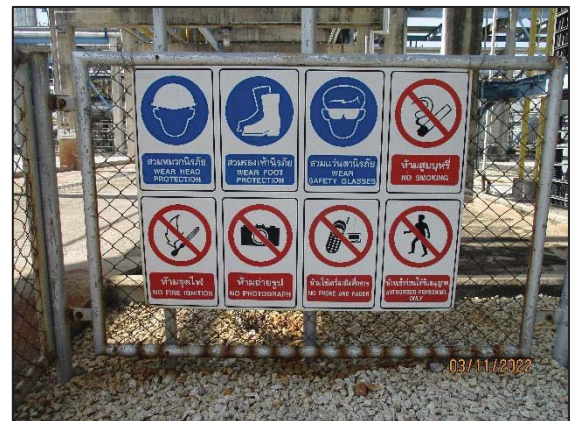
รูปที่ 3.18 ป้ายเตือนอันตราย บริเวณทางเข้า-ออกพื้นที่การผลิต