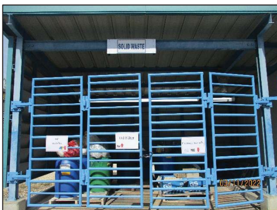
รูปที่ 3.23 อาคารรวบรวมกากของเสีย