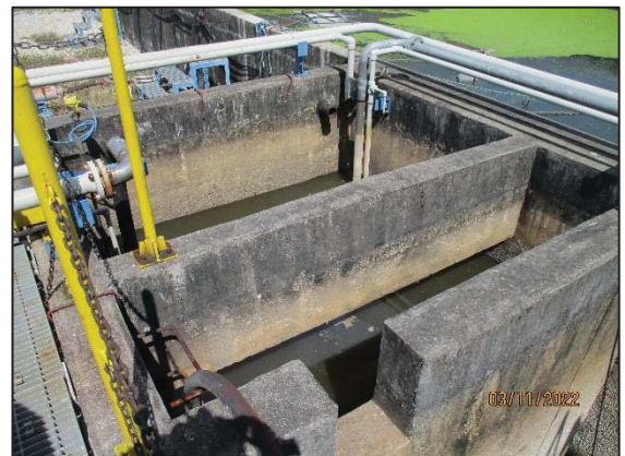
รูปที่ 3.10 Wastewater Holding Pit (F-1801)