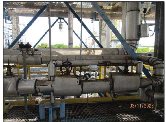
รูปที่ 3.2 Steam Injection