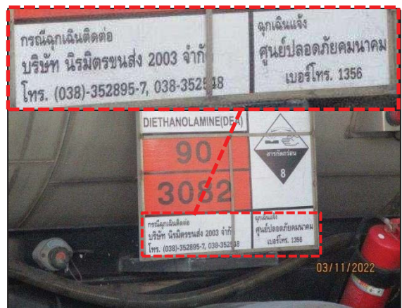
รูปที่ 3.20 ป้ายสารเคมี และเบอร์โทรศัพท์ฉุกเฉิน