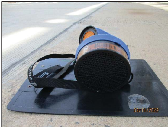
หน้ากากป้องกันสารเคมีเต็มหน้า