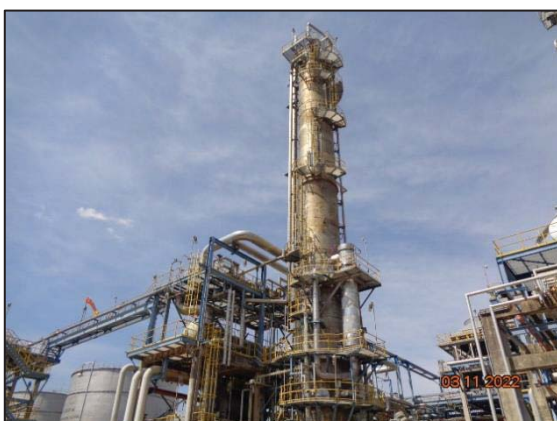
รูปที่ 3.49 ระบบพ่นน้ำลงบนหอกลั่น