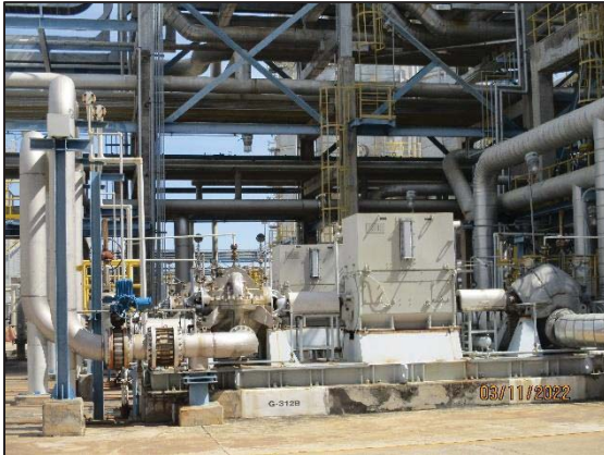
รูปที่ 3.39 ระบบระบายก๊าซ (Relief Valve R-150)