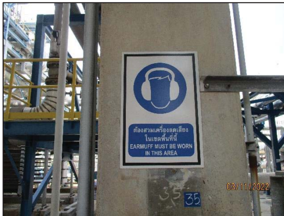
รูปที่ 3.17 ป้ายเตือนให้สวมใส่อุปกรณ์ลดเสียง