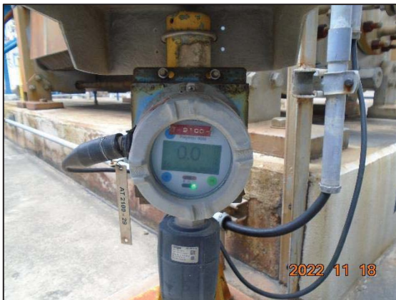
รูปที่ 3.53 Flammable Gas Detector