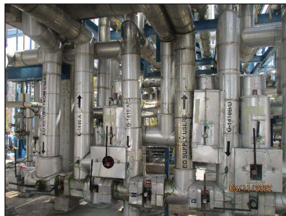
รูปที่ 3.36 อุปกรณ์ที่เกี่ยวข้องกับเอทิลีนออกไซด์ ที่ทำจาก Stainless Steel