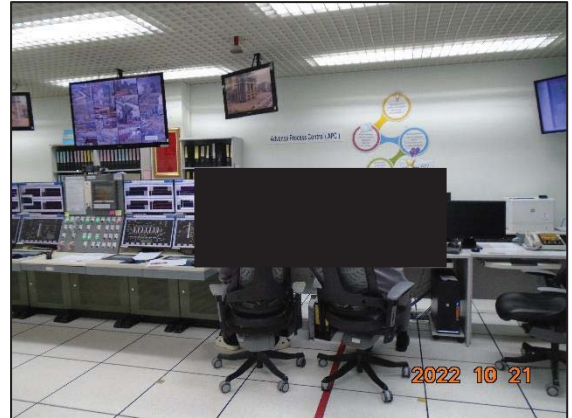
รูปที่ 3.40 ระบบ Distributed Control System (DCS)