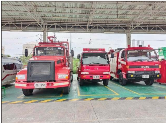
รูปที่ 3.27 รถดับเพลิง (จอดที่ บ. NPC S&E)