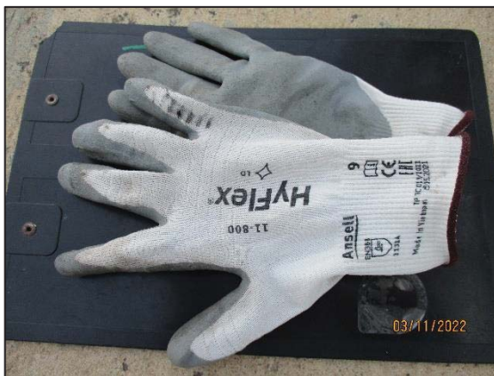
ถุงมือป้องกันสารเคมี