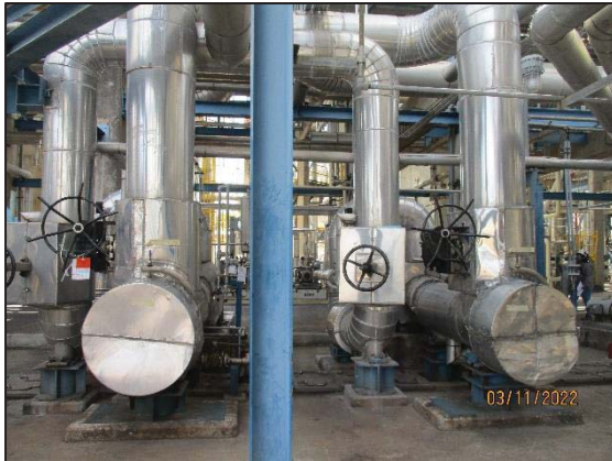
รูปที่ 3.15 Acoustic Insulation (G-624 A/B)