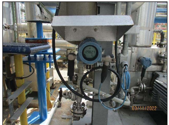
รูปที่ 3.46 เครื่องตรวจวัดอุณหภูมิ บริเวณถังเก็บเอทิลีนออกไซด์