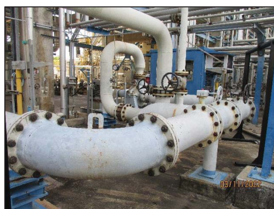
รูปที่ 3.38 Check Valve