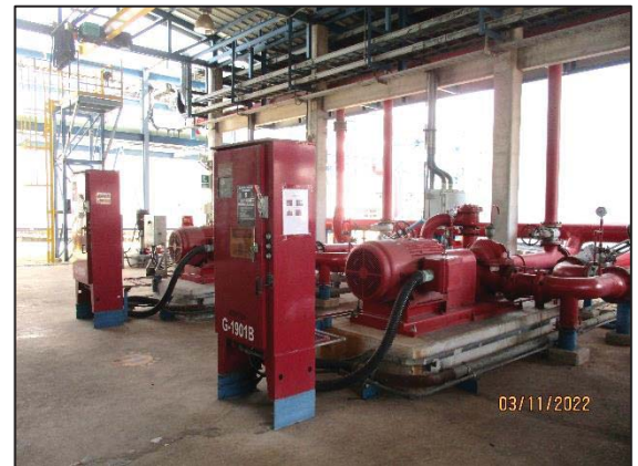
รูปที่ 3.58 เครื่องสูบน้ำดับเพลิง ชนิดไฟฟ้า