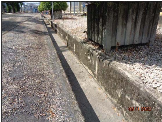
รูปที่ 3.21 รางระบายน้ำฝน