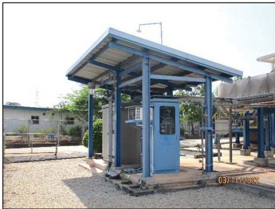
รูปที่ 3.3 CEMS ของปล่อง Waste Heat Boiler