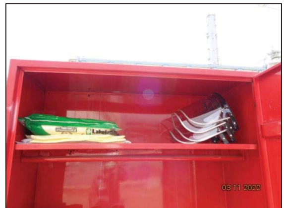
ชุดกันสารเคมีระดับ C