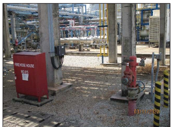
รูปที่ 3.44 Fire Water Monitor