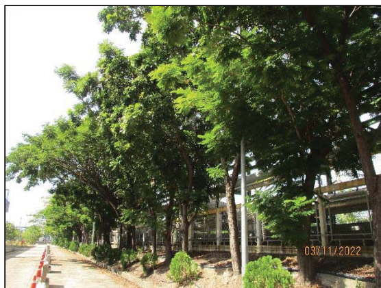
พื้นที่สีเขียวในปัจจุบัน