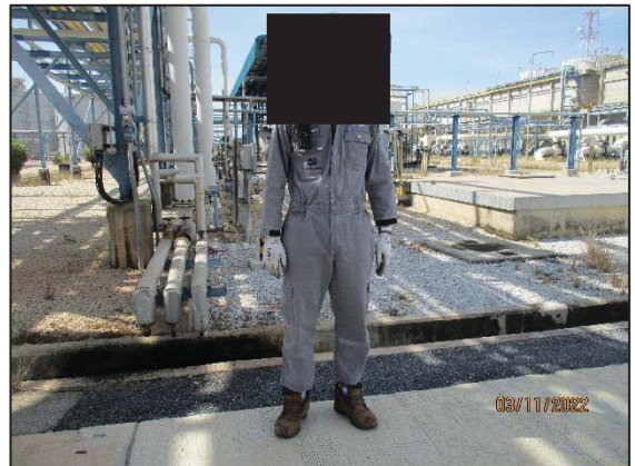
รูปที่ 3.16 พนักงานสวมใส่อุปกรณ์ คุ้มครองความปลอดภัยส่วนบุคคล